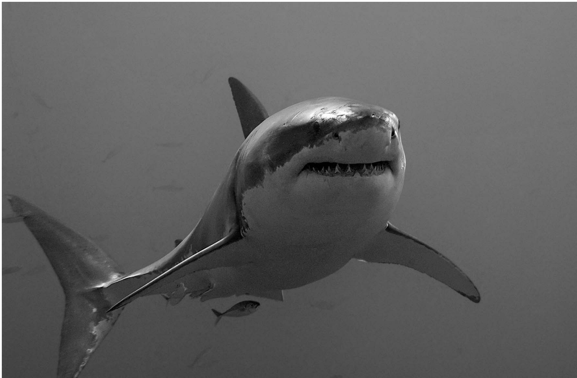
Λευκός Καρχαρίας. Great White Shark ( Carcharodon carcharias ).