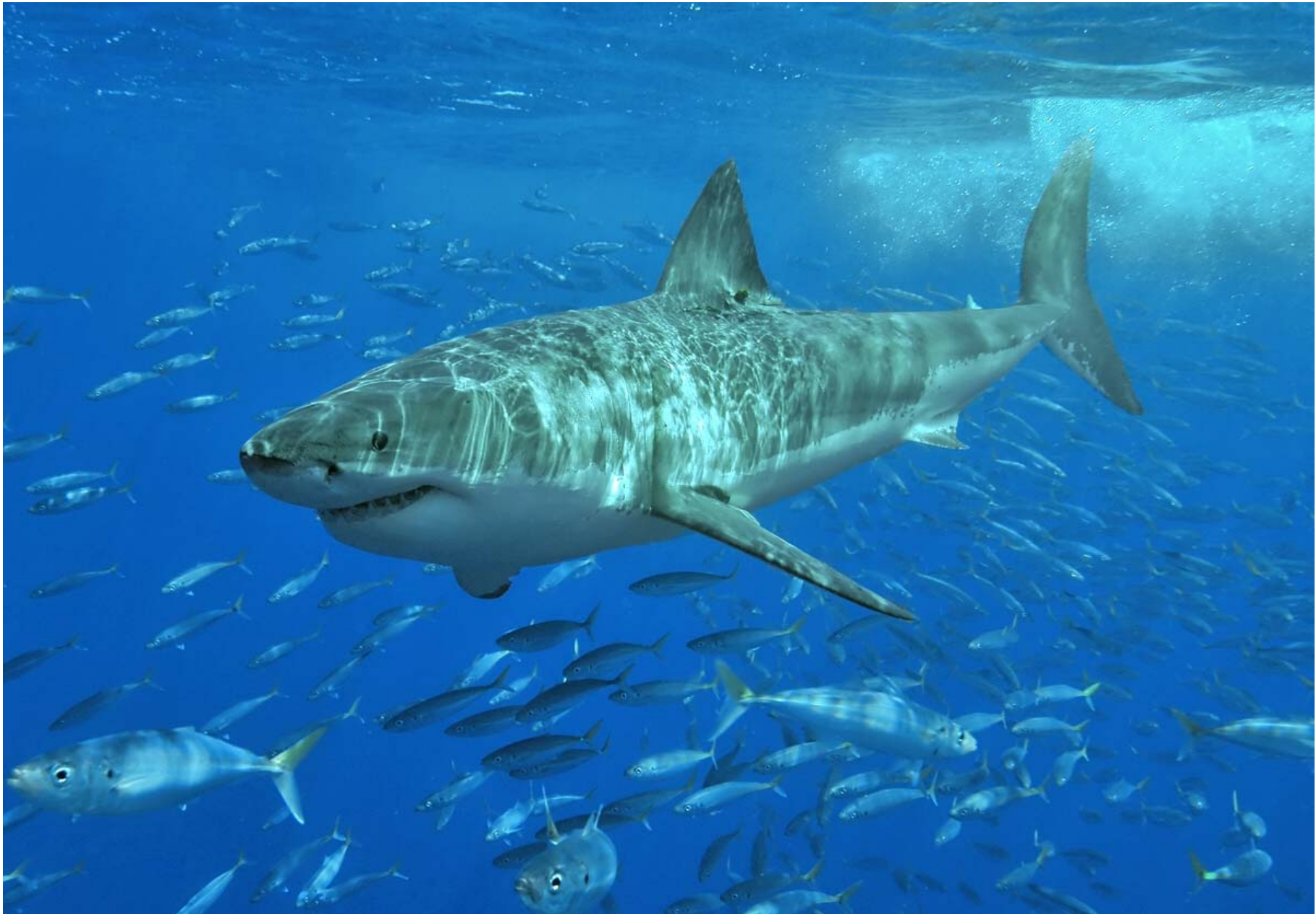
Great White Shark (Carcharodon carcharias). Λευκός Καρχαρίας.