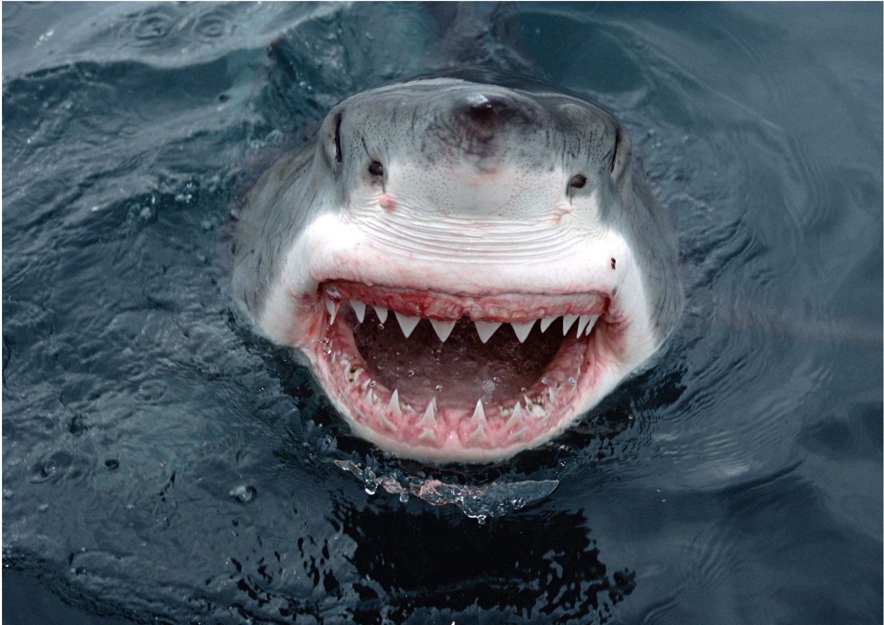
Λευκός Καρχαρίας. Carcharodon carcharias . Great White Shark