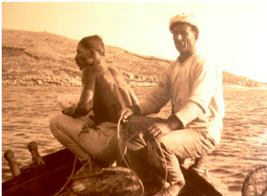
Γυμνός δύτης «παίρνει τον αέρα του» Naked diver on the prow concentrating on his breathing

Τὸβ-βουτ-τ' νοτὴ ντὸν ἄθρωπον - ὄπγοιος τὸν-ἀδικ' ἵσει, ἄς τὸδ-δικάσει ὁ Θεός, πὸν κάμνει δίκ' ἰα γκρίση.