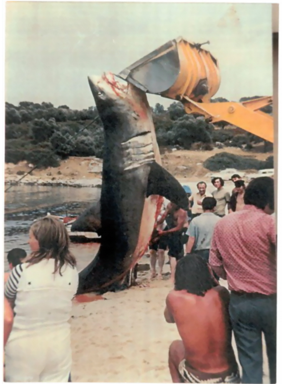
Λευκός καρχαρίας, που αλιεύθηκε γύρω στο 1985 στο Παλιούρι Χαλκιδικής. The white shark that was fished around 1985 in Paliouri, Halkidiki.