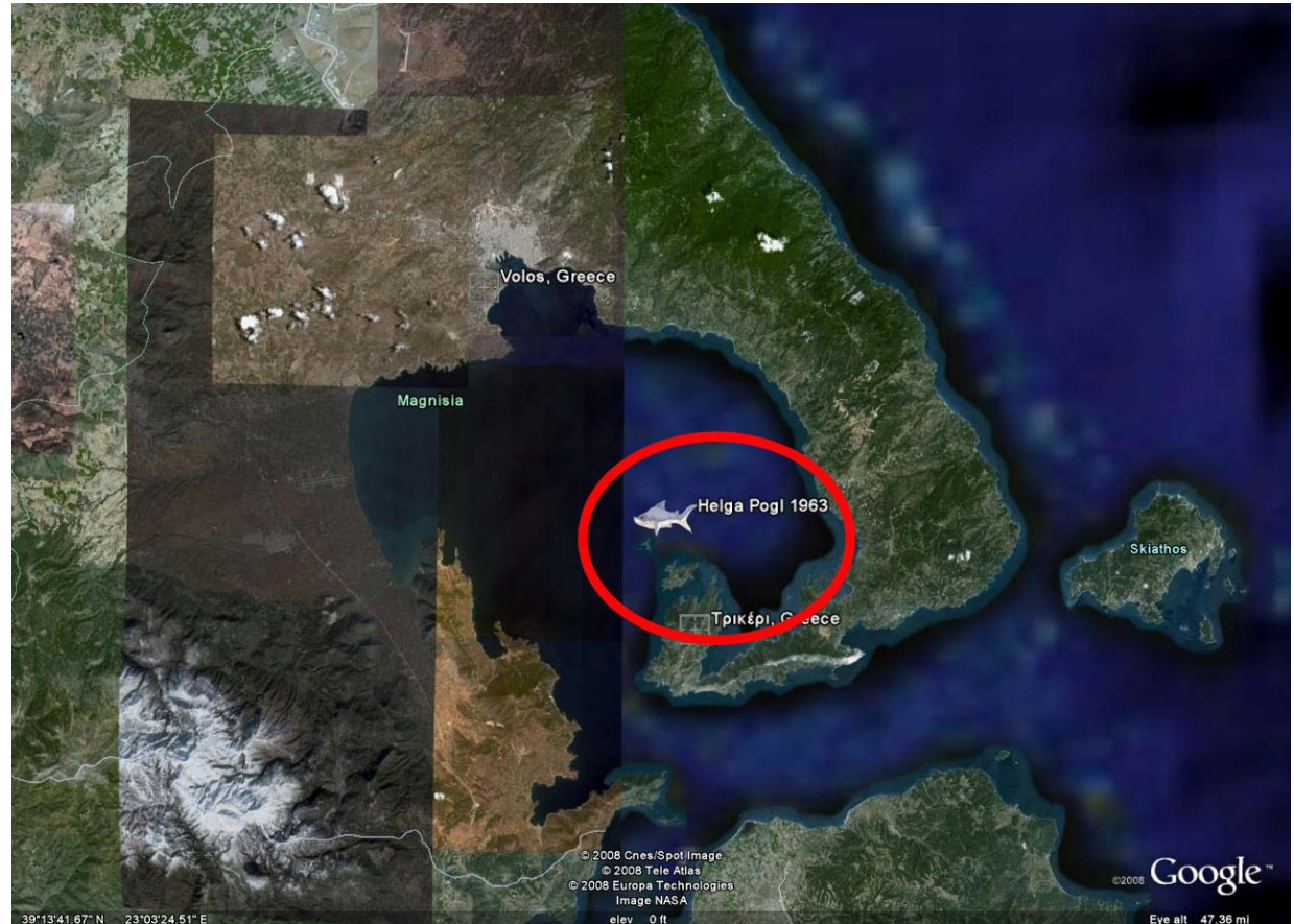
Trikeri island in Pagasitikos gulf Νησίδα Τρικέρων στον Παγασητικό κόλπο